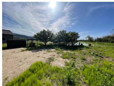
「Field of Stars」制作風景