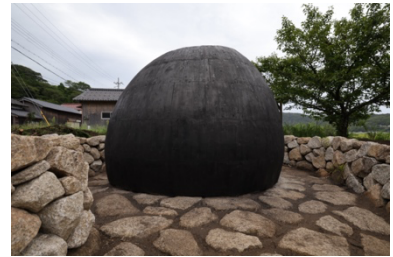
「Field of Stars」2023年