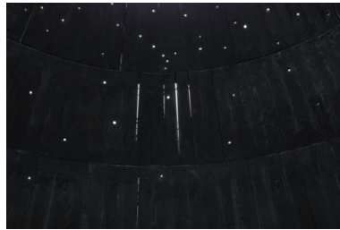
「Field of Stars」2023年