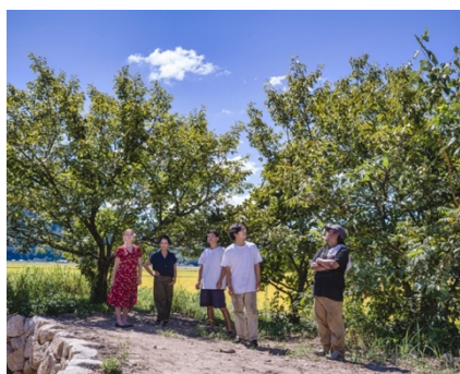
「Field of Stars」協働クリエイター

伝統的な木工芸を家業とする家の三代目として生まれ、大学卒業と同時に父に師事。桶、指物、刳物、ろくろなどの技術を学ぶ。2003年、滋賀県大津市に中川木工芸 比良工房を主宰。作品は、ヴィクトリア&アルバート博物館やパリ装飾美術館の永久コレクションとなっている。