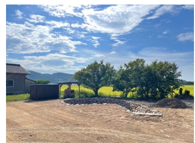
「Field of Stars」制作風景