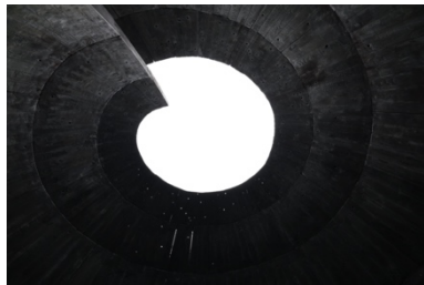
「Field of Stars」2023年