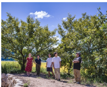
「Field of Stars」協働クリエイター